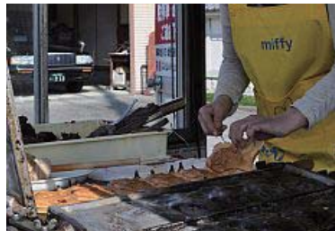
やあ、綺麗に焼けた！こぼれた生地は角のよう でもこれもおいしい！