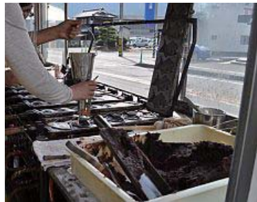
その上に生地を軽くのせて蓋をして…