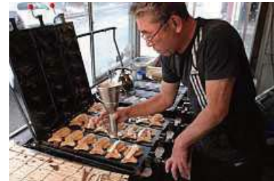
いつも半袖の店主。鉄板の側は暖かった。