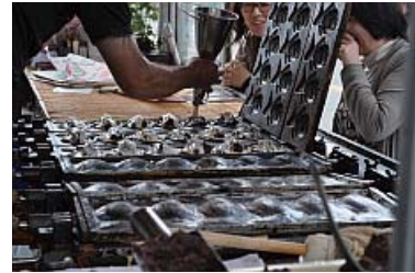
おなじ道具と材料なのに、全然違う！ 「そら、この道何十年も、やっとなやからな。」