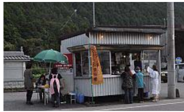
R427 沿い松井庄郵便局の南に、看板もない 小さな店舗。行列ができてることが多い。