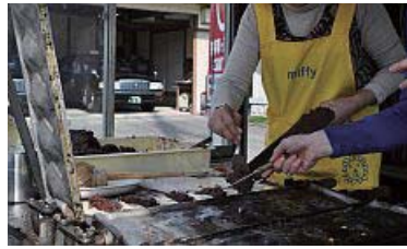
ちょっと生地が多いからあんこを入れたら こぼれる…けどたっぷり入れないと！