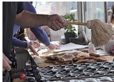
綺麗に焼き上がり、油敷きで焼き型をさっさ。

★クイズ正解者へのプレゼントは… 1名様にたい焼き 10 匹の引き替え券と、 掲載されている魅力探訪紀行七でした。