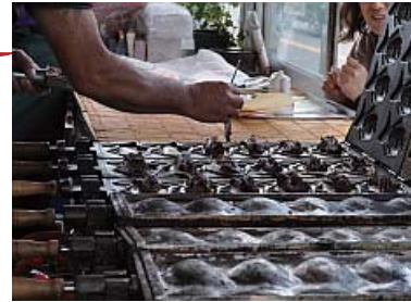
さすがに無駄のない動き…と、手元に見とれる