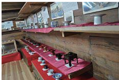
盃台とは酒宴などの時に盃を置く台のこと

次のマイスター工房では冷房も効き特製弁当の昼食をいただく。巻き寿司やおかずの味付けなど、開店前には行列ができるという人気に納得。続いて近くの安海寺で住職の講話。暑さと昼食後で少々お疲れの人も。