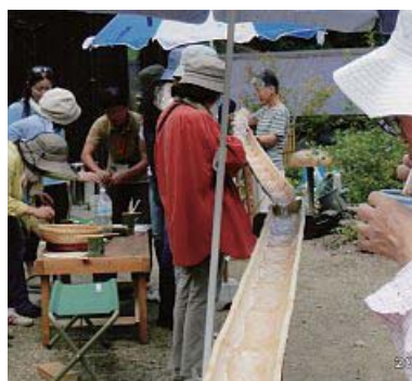
井戸水のそうめん流しは冷たい

JR利用者はスタッフが送迎し、まず農家の畑で野菜収穫。畑で生のピーマンをかじったり、暑さも忘れて盛り上がり、持ちきれないほどの野菜を収穫。