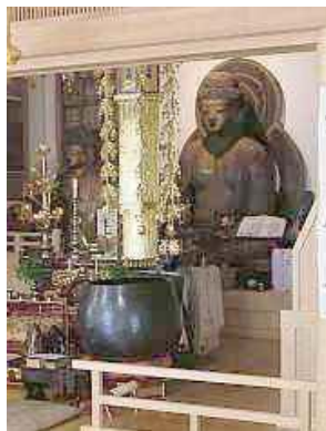
▲薬師如来像(左奥)とご本尊の阿弥陀如来像(右)

★クイズ正解者へのプレゼントは…旧本堂の大黒柱(ケヤキ)で作った念珠と安海寺掲載の北はりま魅力探訪紀行四でした。