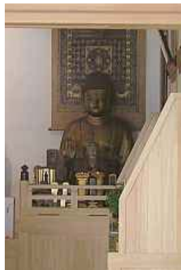
▼本尊右脇の釈迦如来像