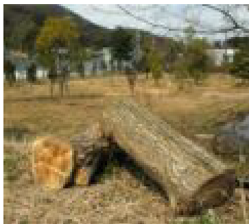
全国の木々が植えられた森。成長がたのしみ。

噴き出てくる。休憩しながら20～40分かけて金蔵寺に到着。本堂では彼岸法要が始まっていたが、縁側に腰かけ、先ずは一服。本堂の傍の千年杉を見上げ、用意されていたお茶を頂く。法要の後、本堂で内護摩が焚かれた。本堂から紫燈大護摩供が行われる山中(護摩場)へ、僧侶、法螺貝を吹く山伏(修験者)、参