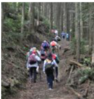
山道をゆっくりマイペースで登る参加者たち。

を取った。本堂まで戻り陽のあたるところで弁当を食べた後、金蔵山を後にした。お陰を頂いたのか、用心して歩く足取りも軽い。あっという間に集落あたりまで下山。彼岸のお墓参りをする人の姿やツクシも出ていたり、のどかな里と護摩焚きの見学で、心も体も大満足。池田