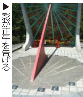
影が正午をさげる