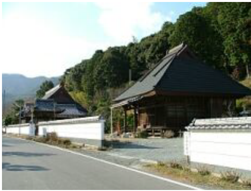
妙覚寺 西脇市市原町 576 鍛冶屋線市原駅記念館北側から西へ 500m 毎年1月4日 10時ごろから行われる

ます。縁側をたたく音は雷の音にたとえられ、悪霊を追い払いとともに作物に十分な雨が降り五穀豊穰を祈るものと言われ