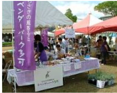
多可町のサテライトからも出店協力