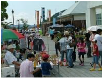
前日の雨から一転、秋晴れが気持ちいい