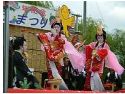
初めての見学者も興味津々の播州歌舞伎