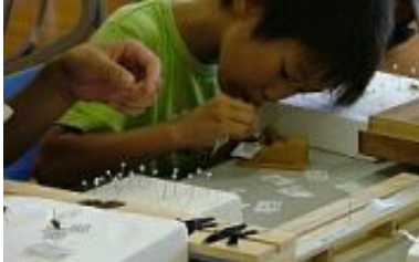
▲平均台で虫ピンの深さを調整