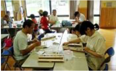
▲細かい作業は父さん母さんも手伝って