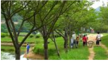
▲虫とりはお母さんに負けないよ