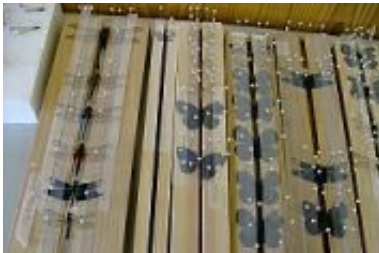
▲無事足や羽が展足台に固定できた