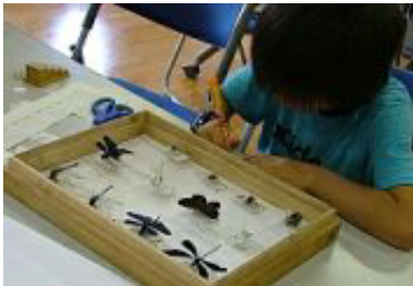
▲ラベルも自分で書いて完成