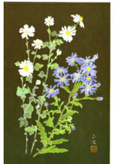
リュウノウギクとヨメナ

ヨメナは7月～10月まで咲く「野菊」のひとつ。この若芽も春菊のような風味があり、若菜摘みの草として親しまれている。リュウノウギクは栽培の小菊かと思うほど。野山で見つけた時は葉を揉んで竜腦(樟腦に似た香りの木)に似たいい香りがすれば間違いなし。秋は花も多く、美しい実をつけるものもあり野草散策には好季節、さぁ出かけてみよう!