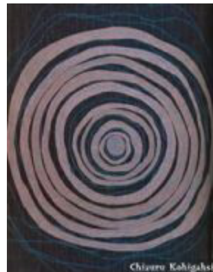
←準グランプリを受賞した作品『点』