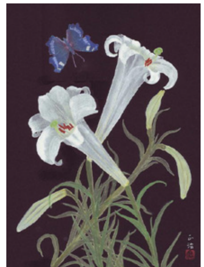
タカサゴユリとルリタテハ

タカサゴユリはここ数年あつと言う間に広まった。土手などに群生しているのが見られる。とても繁殖力があり、自家受粉し、発芽の翌年には開花し、種子を飛ばす。台湾原産の帰化植物で、タカサゴは琉球語のサカサングに由来する台湾の別称。涼しげな色合いのルリタテハは年中見ることができる。