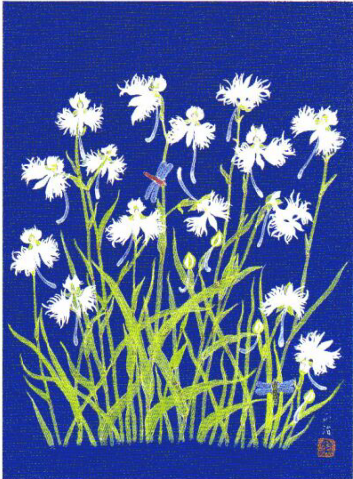
サギソウとハッコウトトンボ