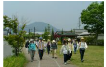
④ 地域の人たちに親しまれていた様子がよく伝わってくる、あかね坂公園