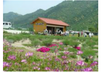
③ ラベンダーはまだ固いつぼみだったがひと月先の満開が楽しみ

天気に恵まれる散歩道!それも新緑がまぶしい好季節。参加者の集合がそろわず、スタートが少し遅れたけれど、笑顔で歩き始めた。駅前の古い町並み、新緑のトンネル、お花畑を見ながら、まっすぐの線路跡を歩いた。スタートとゴールに、今は動かなくなった列車、駅舎跡にはプラットフォームや駅名のプレートが残り、鍛冶屋線の旅を楽しんだ。