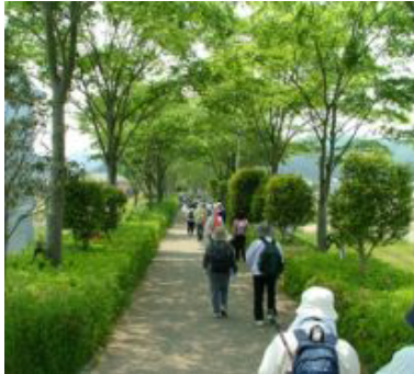
緑のトンネルですれ違った中学生たちは、たくさんの人ときちんと挨拶をしてくれた