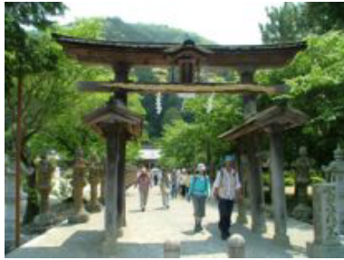
② 春は桜、夏は新緑、秋は金刀比羅さんと紅葉散歩道のポイントの一つはほしい神社