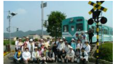
⑦ 無事列車(?)の旅を終え記念撮影鍛冶屋線を歩くpart 2が楽しみ!