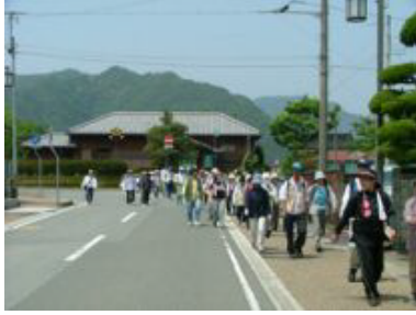
① 駅舎の裏にはプラットフォームも列車も残され線路がないのが不思議なくらい

行程: でんくう総合案内所 ①鍛冶屋線記念館 【鍛冶屋駅】 ②金刀比羅神社 ③ラベンダーファーム ④あかね坂公園【中村駅】 ⑤グリーンプラザ【曾我井駅】 ⑥【羽安駅】 ⑦鍛冶屋線市原駅記念館【市原駅】