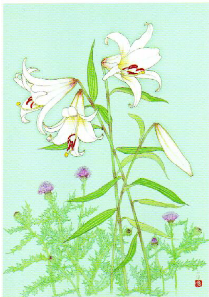
ササユリとノアザミ

種 子で増えるササユリですが、花が咲くまでに7年ぐらいかかりとても成長がゆっくり。また、陽が当たらない時は、葉っぱ1枚だけ付け、環境が整うまでじっと耐えています。その上、猪はユリ根を鹿は花や葉を食べ、人間の盗掘があり、花を咲かせることができるのはごくわずか。この絵の左の株のように、1本に2つの花を付けるのは充実したユリ根を持つもの。見かけたら、笹に似た葉っぱを確かめ、いい香りと美しい姿を楽しむだけに。