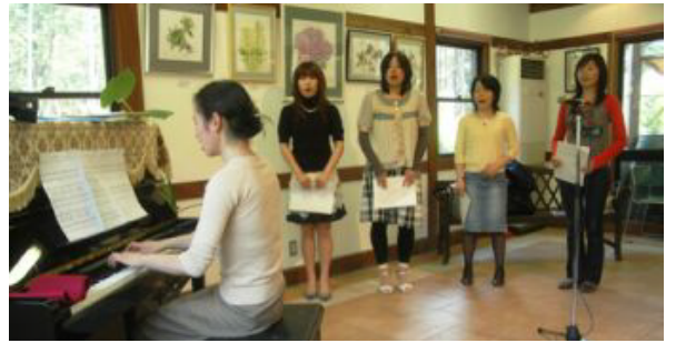
フォルクスで美しいハーモニーのでんくるソングを録音