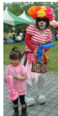
風船で動物などを作るバルーンアート

子どもたちの笑顔や歓声が広がる地域であってほしいとの願いで、ステージの組み立てから駐車場係、アトラクションや体験教室、汗だくの着ぐるみ役など多くの協力を得ることができた。