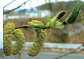
オオバヤシャブシの雌花と雄花

の房のようなものがたくさん付いている。染料になるハンノキの種類でオオバヤシャブシの花である。周辺には同種のヤシャブシ、ヒメヤシャブシも生育し、比べると興味深い。