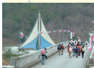
翠大橋とテントが印象的な翠公園