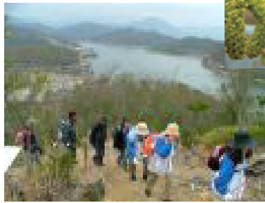
翠明湖が一望できる南口みはらしの道

ダム堤を渡り東岸の道を北上。1週間後の翠明湖マラソンでは熱いレースが展開されるコースも、今日は車の通行もほとんどなく、のんびり歩くことができる。その翌週ぐらいが満開かしら、とつぼみを付ける桜の多いことに気づく。桜と同じくらい多い木に黄緑色