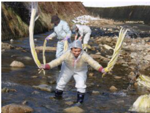
初めての体験は楽しいが、仕事となると寒くて辛い作業

次は、雪が残る加美区の杉原紙研究所を見学し、全員が紙すきを体験。そして希望者のみ、こうぞの川さらしを体験しました。雪が降りそそぐ中で長靴とゴム手袋にカッパを着て凍りつくような川のなかへ、見学者の大声援を受け果敢に挑戦。もう立派な紙すき職人の誕生です!?