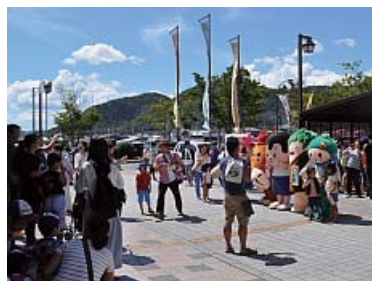
マスコットキャラクターのでんくる、たか坊、にしー、黒田牛兵衛、加東伝の助はどこでも子どもたちに人気。お父さんはスマホで記念撮影。