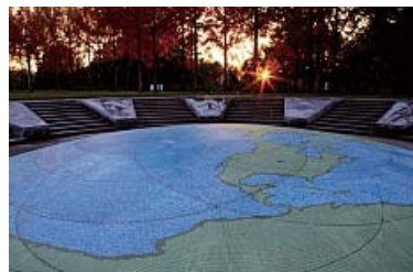
茜色のへそ公園 村上よしみ 日本へそ公園