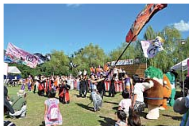
ステージアトラクションの最後は総踊り。よさこい4チームと大旗振りに、ゆるキャラも参加。