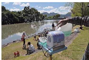
池の横ではたくさんのシャボン玉が風とダンス！

「去年は嵐の中のでんくうまつりやったね」と笑顔であいさつ。本当に今年は空が青く風もさわやか。新聞記事や他のPRのおかげで続々と来場者が。あつという間に駐車場は満車になり、30分待ちもあった様子。