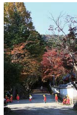
は〜い、集合! 岡本和男 都麻乃郷あじさい園(西林寺)