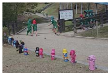
元気いっぱい 森本猛 多可町北播磨余暇村公園