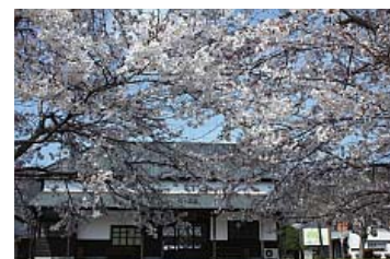
花のアーチ 松原茂光 鍛冶屋線市原駅記念館