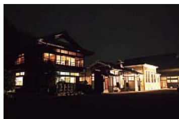
ナイトミュージアム 古谷野英子 コヤノ美術館西脇館(国登録有形文化財)