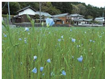
亜麻の花 河野太寿代 ASABAN プロジェクト