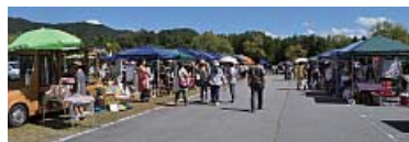
洒落たお店が並ぶ播州つながりマーチのエリア。お客さんとの会話も楽しみながら販売。