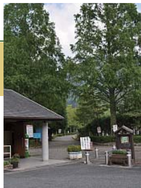
多可町北播磨余暇村公園駐車場から200m進むと