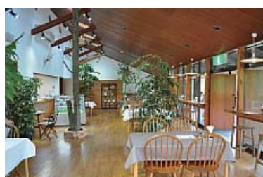
内部は明るく、テラスから森が目の前に広がる