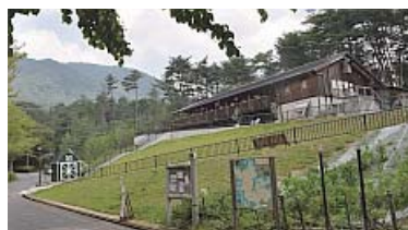
右上にcafé chattanaの森が見えてくる