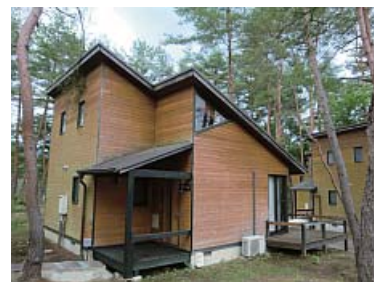
松林の中に1軒ずつ建つコテージ

森の中のホットステーション“ココロン那珂・chattana の森”に是非、お出かけください。