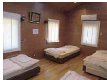
コテージ内部 和室仕様もある