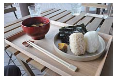
手づくり味噌の味噌汁とおにぎり シンプルなメニューがうれしい