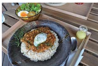
キーマカレーは玄米、白米が選べる