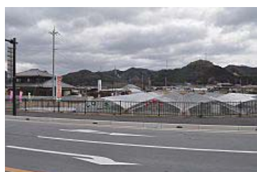
明楽寺信号の東側、イチゴハウスが並ぶ