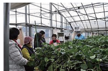
11,000株を栽培、暖かくなるといちごの生育が早くなり管理作業も忙しくなる

★クイズ正解者へのプレゼントは・・・ 2名様に1,000円相当のいちご加工品 引換券でした。