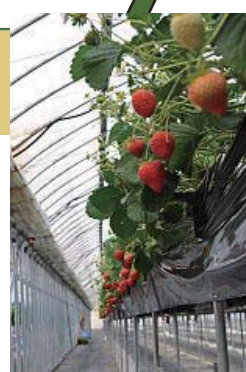
高設栽培は、いちご狩りだけでなく管理作業もしやすい