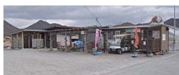
販売所の前が駐車場、奥にはWCも設置

2003年にオープンしてから今年11年目を迎えた、高設栽培、ハイテクシステムを導入されている「観光農園篠田いちご園」を訪問しました。