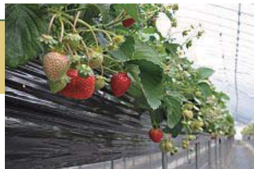
いちごの食べ方：先が甘いので、ヘタを取ってヘタの方から食べる

販売(いちご、シャーベット、アイスクリーム、ジャム、いちご餅)/12月～5月 いちご狩り/1月～5月(要予約)