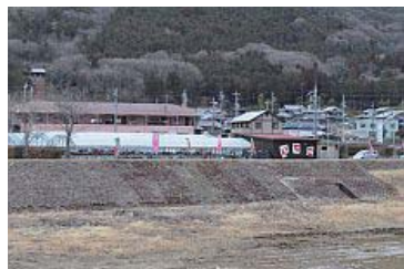
野間川沿いの県道からも看板やノボリが