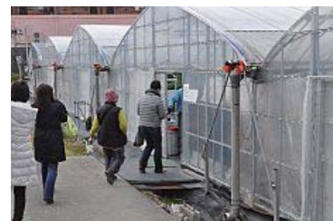
ハウス内では手荷物がいちごを傷つけることがあるので荷物を預けて・・・