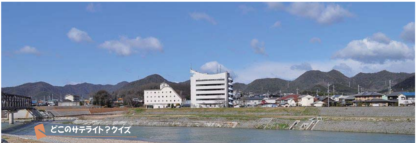
どこのサテライト？クイズ

※ サテライトとは 北はりま田園空間博物館に 登録されている見どころです まるごとガイドやホームページに 200あまり紹介されています