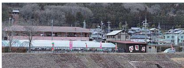
ノボリや看板でわかりやすい

※ サテライトとは 北はりま田園空間博物館に 登録されている見どころです まるごとガイドやホームページに 200あまり紹介されています