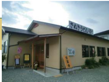
マックスバリュの道路向かいでわかりやすい