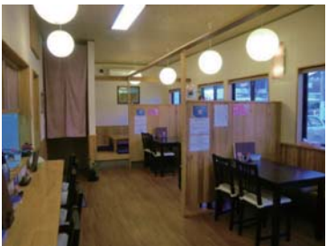
カウンター席、テーブル席、座敷計 28 席