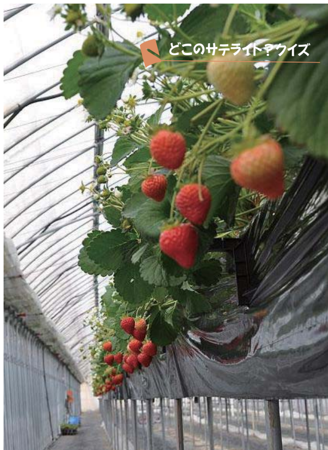
どこのサテライト？クイズ

子どもから大人まで大人気のいちご！大きくて甘～いいちご狩りができるのは5月ぐらいまで。野間川沿いの県道を北上、橋を渡って南に曲がるとハウスの前に到着。直売所では新鮮ないちごやいちごの加工品を販売。シーズン中はいちごが不足する程の人気なので、予約した方が安心。