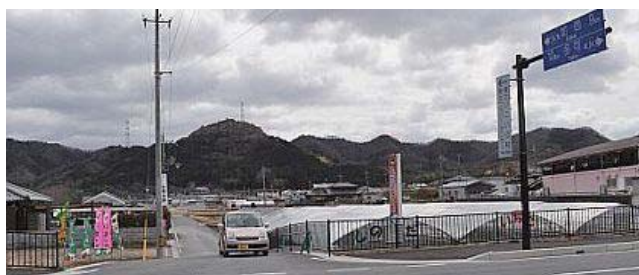
道路はカーブして橋を渡りちょうどハウスの横