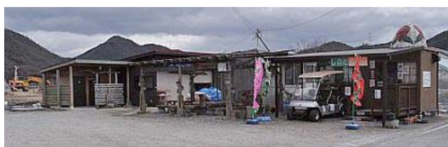
信号手前の三叉路を南に曲がると直売所