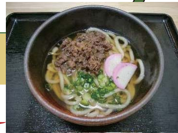
肉うどん 650 円