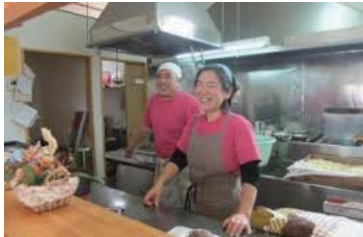
夫婦仲良く、笑顔で「いらっしゃいませ!」