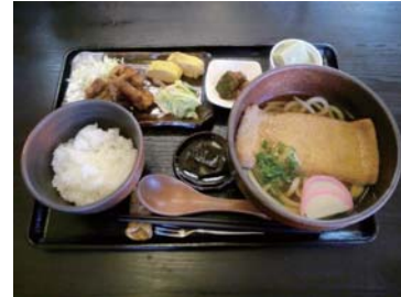
きつねうどんの定食 550+350=900 円