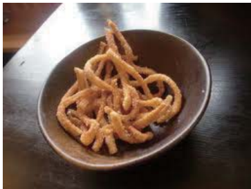
注文して待ち時間に出てくる「うどんのかりんとう」