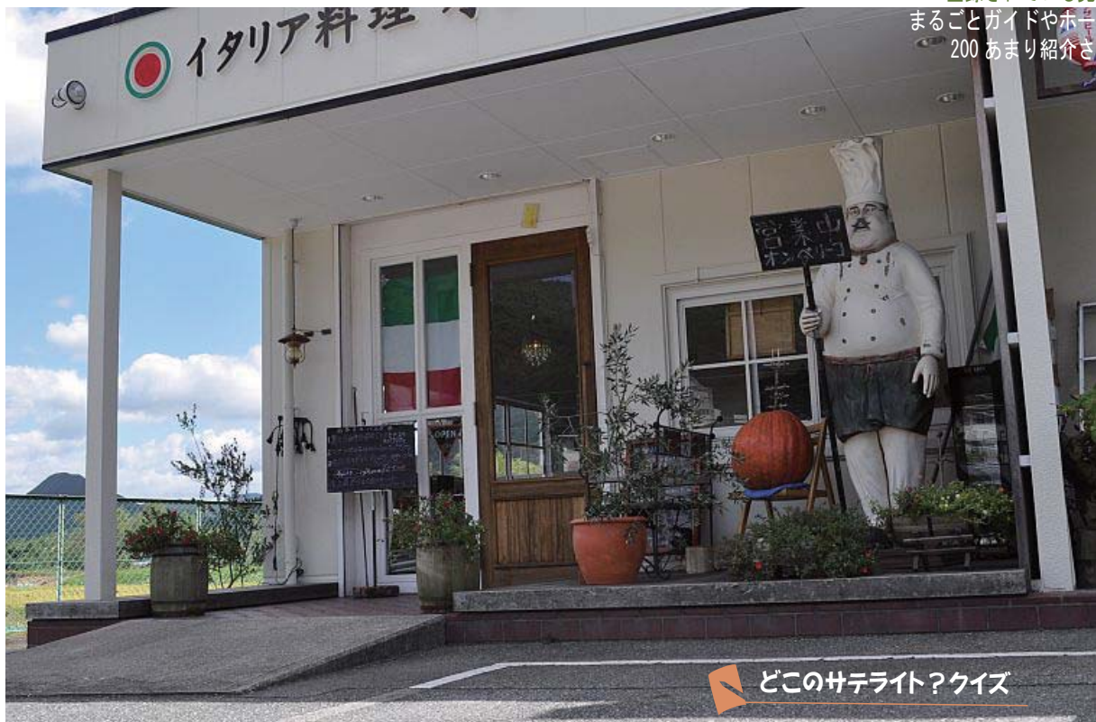
どこのサテライト？クイズ

※ サテライトとは 北はりま田園空間博物館に 登録されている見どころです まるごとガイドやホームページに 200あまり紹介されています