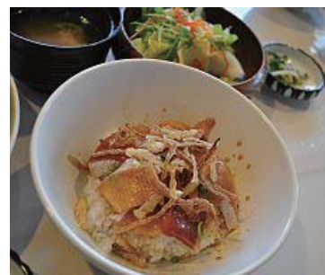
ブリの漬け丼の上にはスルメが

旬の魚や肉と野菜での創作料理。目でも楽しみ美味しいとみんなに好評だった。(メインなどは週ごと、または日により変わる)