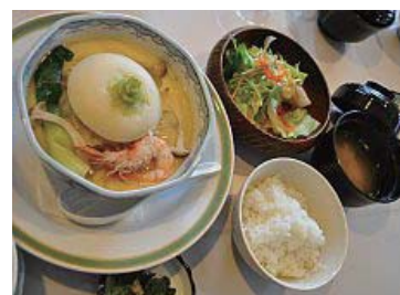
かぶら蒸しは冬限定メニューですね

★クイズ正解者へのプレゼントは…1名様にごはん屋 I B U K I のお食事券 (2,000円) でした。