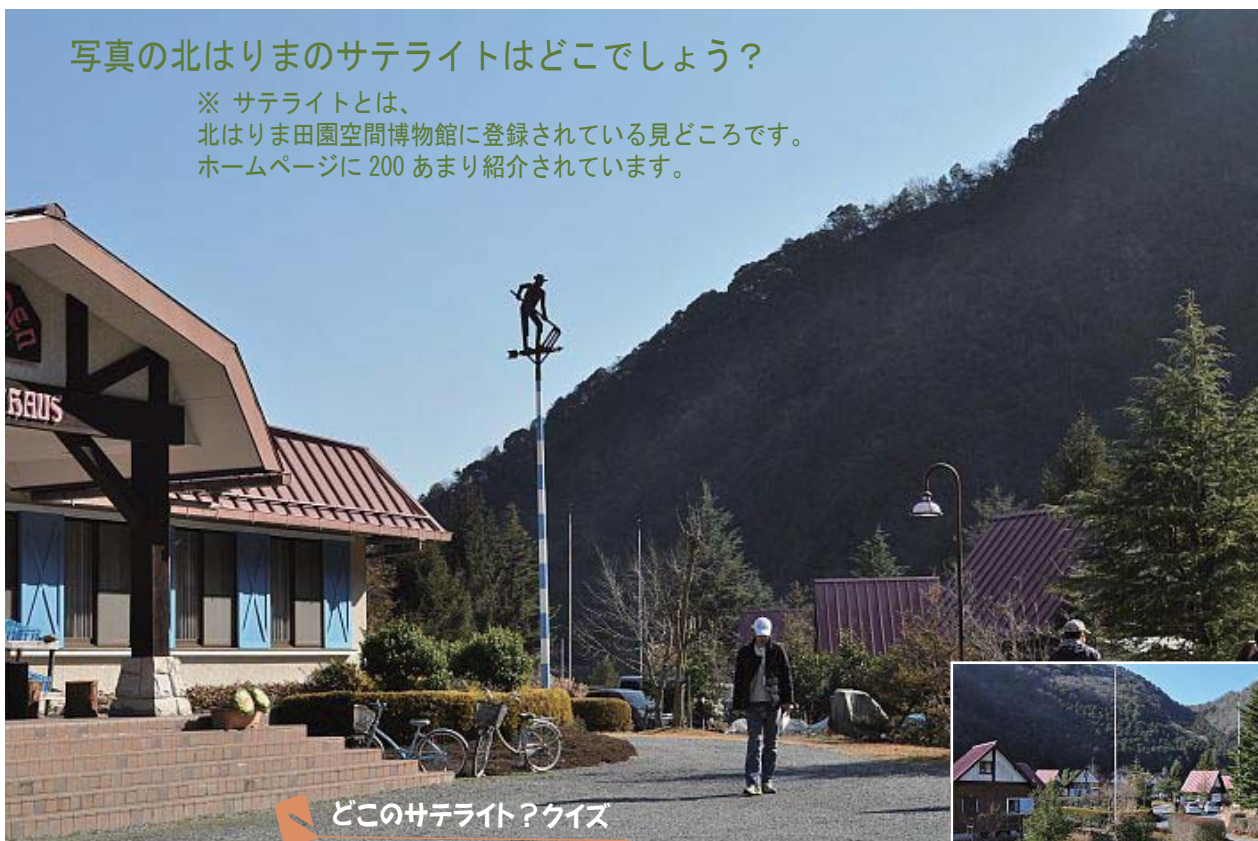
どこのサテライト？クイズ

※ サテライトとは、 北はりま田園空間博物館に登録されている見どころです。 ホームページに200あまり紹介されています。