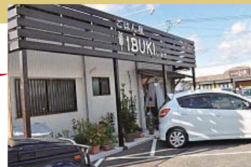
Aコープ西脇店の道路を挟んだお向かい

Aコープ西脇店の正面、R427号沿いにある ごはん屋 I B U K I はお買い物のついでに立ち寄り、ここで食事をした後お買い物も出来る便利な所。お店の前に7台ほどの駐車スペースがあるが、お買い物をすればお向かいの駐車場でもいいかな。