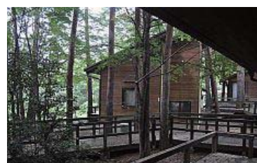
目覚めると窓からこんな景色と野鳥のさえずり、暖かい日ざし…いかがですか