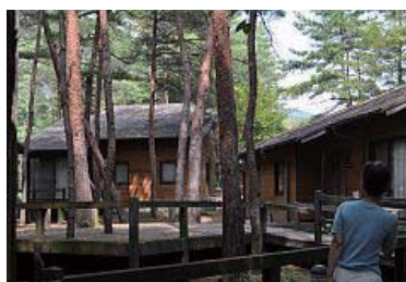
レストランから出てまっすぐ進むと赤松林の中に木道があり10軒ほどのコテージへ