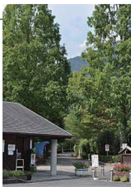
多可町北播磨余暇村公園の駐車場に車を置き入り口から100m程行くと右上にレストラン