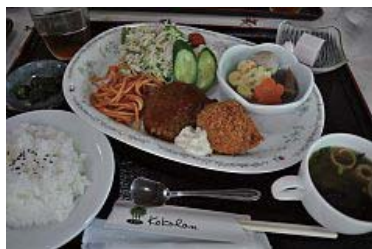
今日のお任せ定食はハンバーグとコロケ周辺に食事のできる所が少ないので賑わう