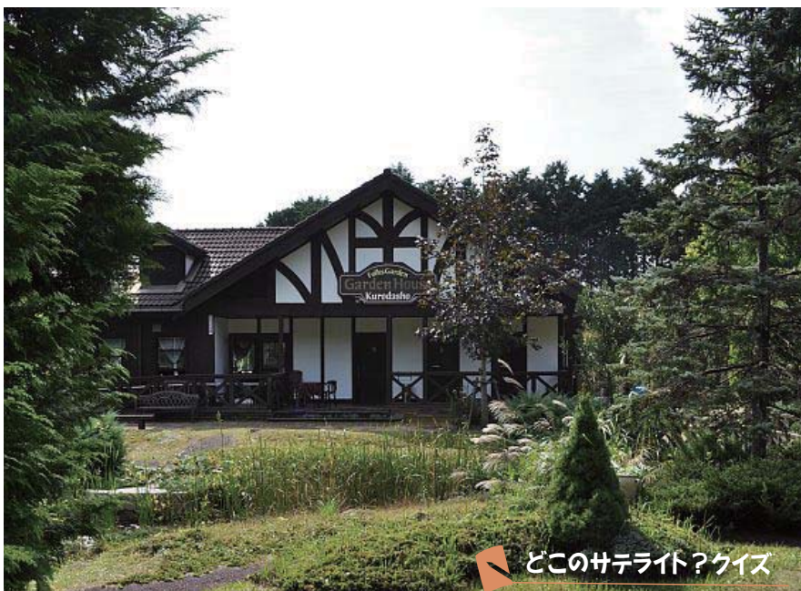
どこのサテライト？クイズ

8月末にリニューアルオープン。外観は変わらないが、内部はイギリスかアメリカの田舎にありそうな店に。ティータイムやランチが気軽に楽しめるようになった。播州織の衣類やニットのセーター、素敵な小物も販売。ドライブの休憩に、おしゃべりしながら庭の散策、ひとりで野ウサギが飛び出すのを待っているのもいいかな。