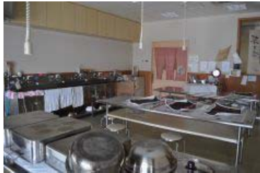
草木染め体験室は設備が充実。初級、中級など クラス分けの教室が行われている。(要予約)