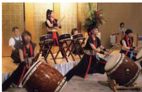
見事な演奏と迫力にみんな拍手！