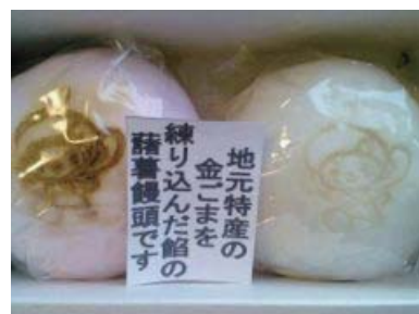
参加者のお土産はあさひ屋の金ゴマを練り込んだ薯蕷饅頭(じょうよまんじゅう: ナガイモの粘りを利用して米粉を練り上げ、その生地を餡を包んでしっかりと蒸し上げた) でんくうの君の焼き印入り