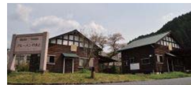
8人まで宿泊できるひゅってやまとは 2棟あり、調理設備や食器・寝具も用意されている。食材さえあればリゾート気分を味わえる。利用料は土日4名以下の場合12,600円(平日10,000円)。

★クイズ正解者へのプレゼントは…なごみの湯入浴券と特産品引換券 ¥2000相当でした。