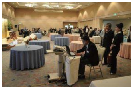
休憩の間もパーティーで使う映像のリハーサル