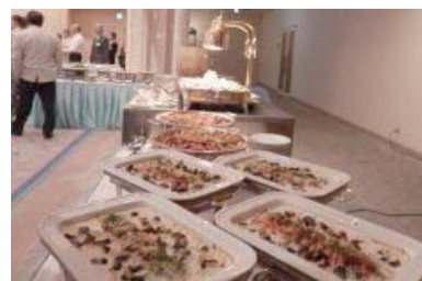
マカロニグラタン、揚げ物盛り合わせ、豚角煮(トンボロー)、ジャーマンポテト