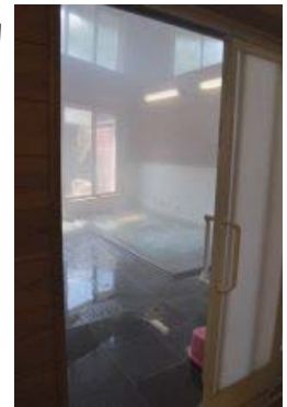
なごみの湯は比較的すいているので、 のんびり入浴タイムを味わえる。