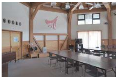
八角屋根の多目的ホールは地元の法事から イベントにも活用され、カラオケもOK。 使用料は1時間2,000円