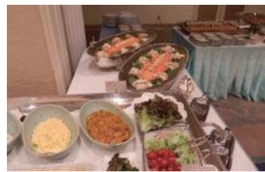
手前からクラッカーディップ(パンプキン、アボカド、トマト、チーズ、エッグ) スモークサーモンカルパッチョ、巻き寿司、いなり寿司

いつもお世話をしている会員やスタッフも料理や会話を楽しめるパーティーをと実行委員会は企画し、記念品もココだけの物とこだわって用意した。10 周年をステップとし今後も活動を続けていきたい。