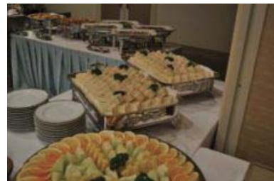
フルーツ盛り合わせ、サンドイッチ他にもプチケーキ、アイスクリーム、ジュースなど