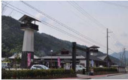
おなじみの道路沿いからの外観 大石内蔵助にちなみ武家屋敷風