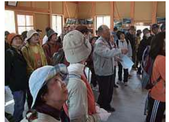
末谷池展示室では昔の人々が知恵と力を集結して造った資料が展示