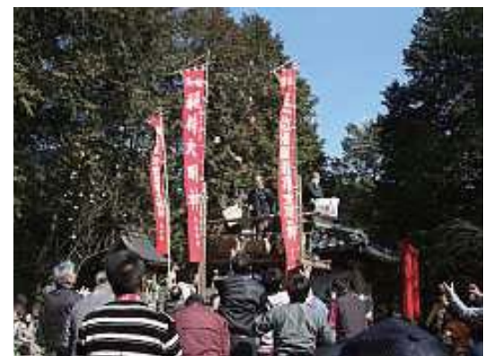
にぎわった二ノ午の餅まき