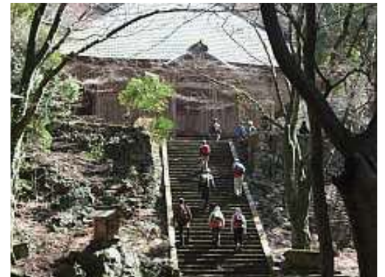
荘厳寺本堂では静寂が迎えてくれる