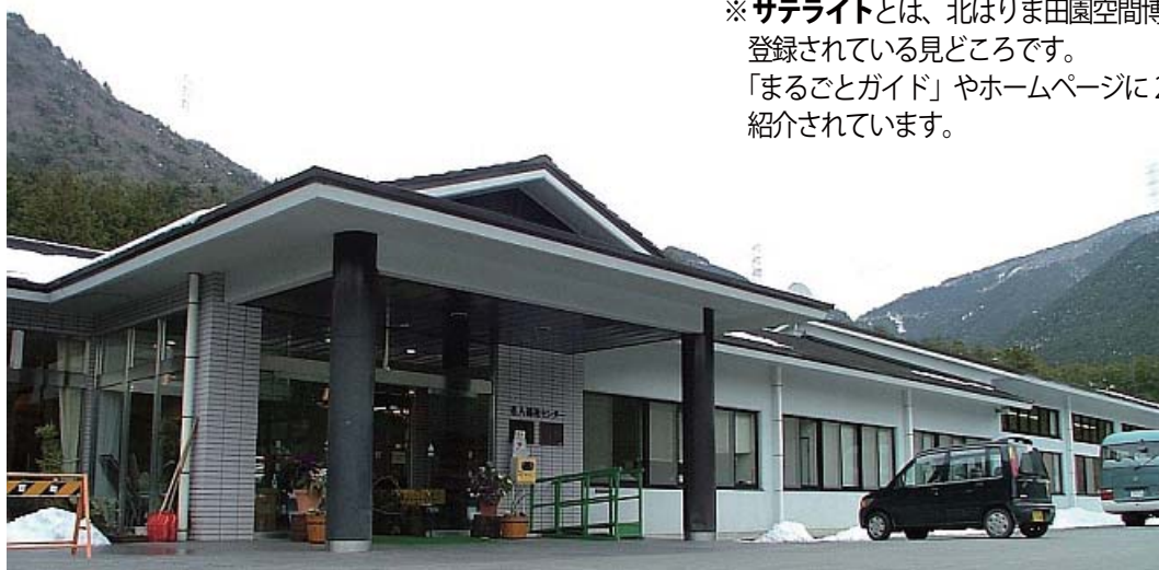
ラドン温泉 お隣には桜公園があります

※サテライトとは、北はりま田園空間博物館に登録されている見どころです。「まるごとガイド」やホームページに200あまり紹介されています。