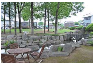
駐車場とは異空間のくつろぎエリア