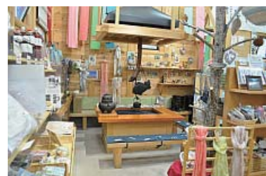
入り口左奥にある囲炉裏コーナー