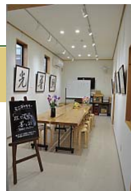
入り口から右奥にある展示コーナー