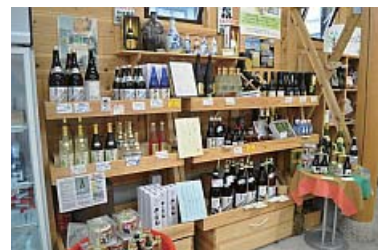
町内産山田錦の日本酒がずらり