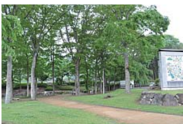
駐車場の奥、播州歌舞伎モニュメントの裏