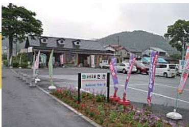
写真の右にはおむすびキッチン夢蔵がある