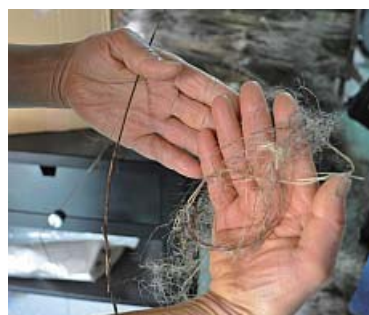
この繊維は「亜麻色の髪の乙女」の亜麻色

神戸のレストランのオーナーシェフが「愛用の布巾と同じ物を作ってほしい」との声がきっかけ。扱ったことのない繊維(リネン)で、調べるととても魅力的な特徴を持ち、今後の夢が広がった。播州織の技術を活かすと、多様な製品ができる。早速販売を始めたが、繊維自体も地元で生産できれば