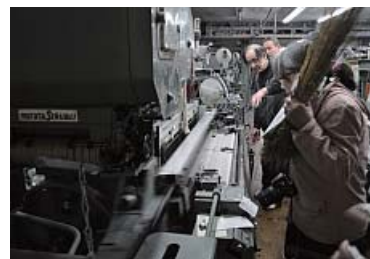
播州織の技術があるから、多様な製品に

と、4年前に種を手に入れ栽培を始めた。が、それは油用の品種とわかり繊維用の亜麻の栽培を手探りで3年半。繊維が取れた。