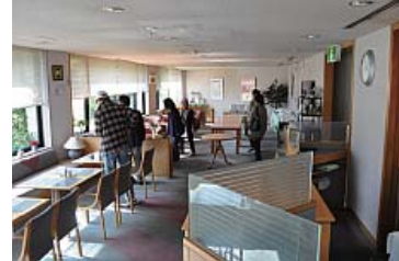
本館1Fにあるレストラン