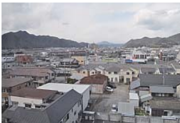
通路側（北）からは西脇の街並みが一望