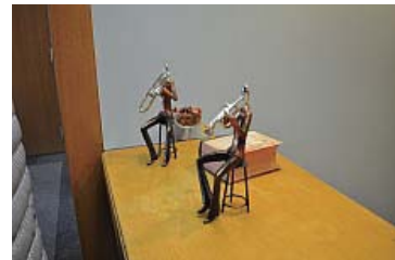
素敵なインテリアがさりげなく置かれている