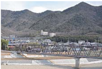
客室から加古川を望む