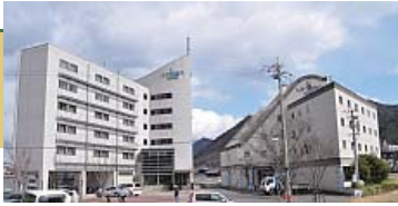
波、船、栈橋をイメージした個性的な建物