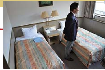
ツインルームもある

★クイズ正解者へのプレゼントは1名様に1,200円のアーバン定食(夕食)お食事券2枚でした。