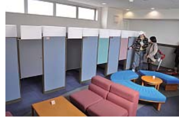
インターネットカフェ&リラクゼーションルーム