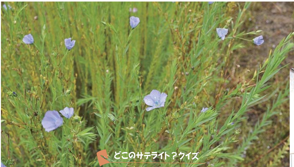
どこのサテライト？クイズ

※ サテライトとは 北はりま田園空間博物館に 登録されている見どころです まるごとガイドやホームページに 200あまり紹介されています