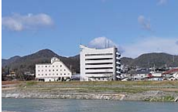
加古川対岸からの姿は印象的