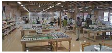
広い店内と生産者の顔写真(中央)

西脇市野村町800-1 TEL/0795-24-7900 FAX/0795-24-7910 営業時間 / 9:30 ~ 18:00 年末年始のみ休館