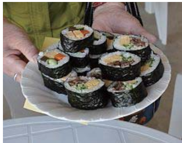
左、こんにやく入り巻き寿司 380円 右は牛肉巻き 630円

北はりま旬菜館にオープンカフェがあると聞いてやって来ました。土日の9時半~12時だけ野菜生産者がボランティアで開いているお店とか。