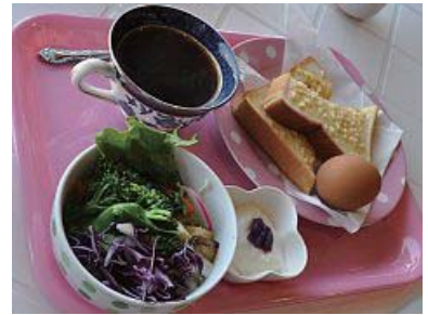
季節によりサラダの野菜が変わります