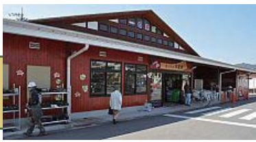
入り口の右側にあります