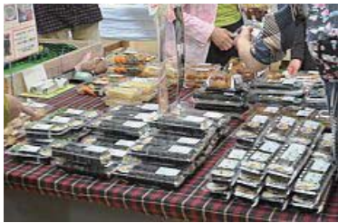
巻き寿司の奥には加工グループのお総菜も出来たてが並びます