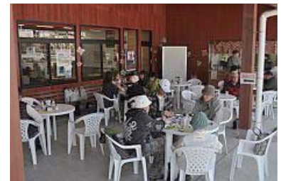
モーニングカフェは土日のみ9時30分~12時 380円

★クイズ正解者へのプレゼントは...5名様に旬菜館ブレンドのドレッシング、ごまポン酢の詰め合わせでした。