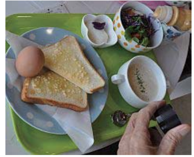
おいしいドレッシングをたっぷり

旬菜館でのお買い物は、こんな楽しみもあり家族の健康やお財布にもやさしいし、地元農家の応援にもなり良いことづくめ。まだの方はぜひお出かけください!